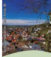
Foto von Waldaschaff